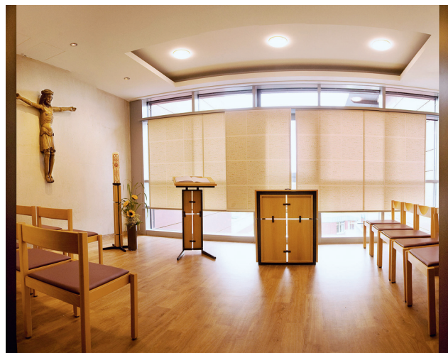
Andachtsraum im Neubau auf der Ebene 4, ZNG (Zentrum für Neuromedizin und Geriatrie)

ALS RÄUME DER STILLE STEHEN IHNEN UNSER ANDACHTSRAUM UND UNSERE KAPELLE JEDERZEIT ZUR VERFÜGUNG.