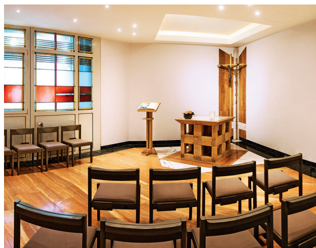
Kapelle im Haupthaus auf der Ebene 0

ALS RÄUME DER STILLE STEHEN IHNEN UNSER ANDACHTSRAUM UND UNSERE KAPELLE JEDERZEIT ZUR VERFÜGUNG.